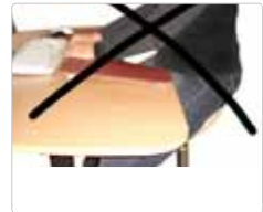
Abb. 3 - Zu Niedrig