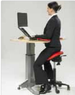
Abb. 1 - Die korrekte Höhe der Tischplatte

Die Höhe des Tisches kann mit eigenen Einstellungen vorgenommen werden, in dem Sie die Beschläge des Herstellers verwenden oder der Tisch muss anderweitig angehoben werden. Ein zu hoher (Abb. 2) oder zu tiefer (Abb. 3) Tisch kann zu Rücken-, Schulter oder Nackenproblemen führen. Die Ellenbogen sollten entspannt, neben dem Körper, auf der Tischplatte liegen.