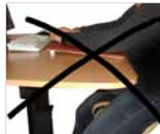
Abb. 2 - Zu Hoch