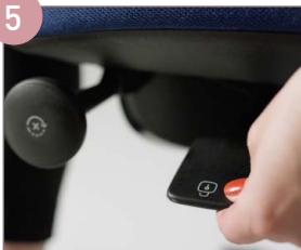
ARRETIERUNG DER NEIGUNGS- MECHANIK ENTRIEGELN