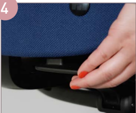
HÖHE DER RÜCKENLEHNE